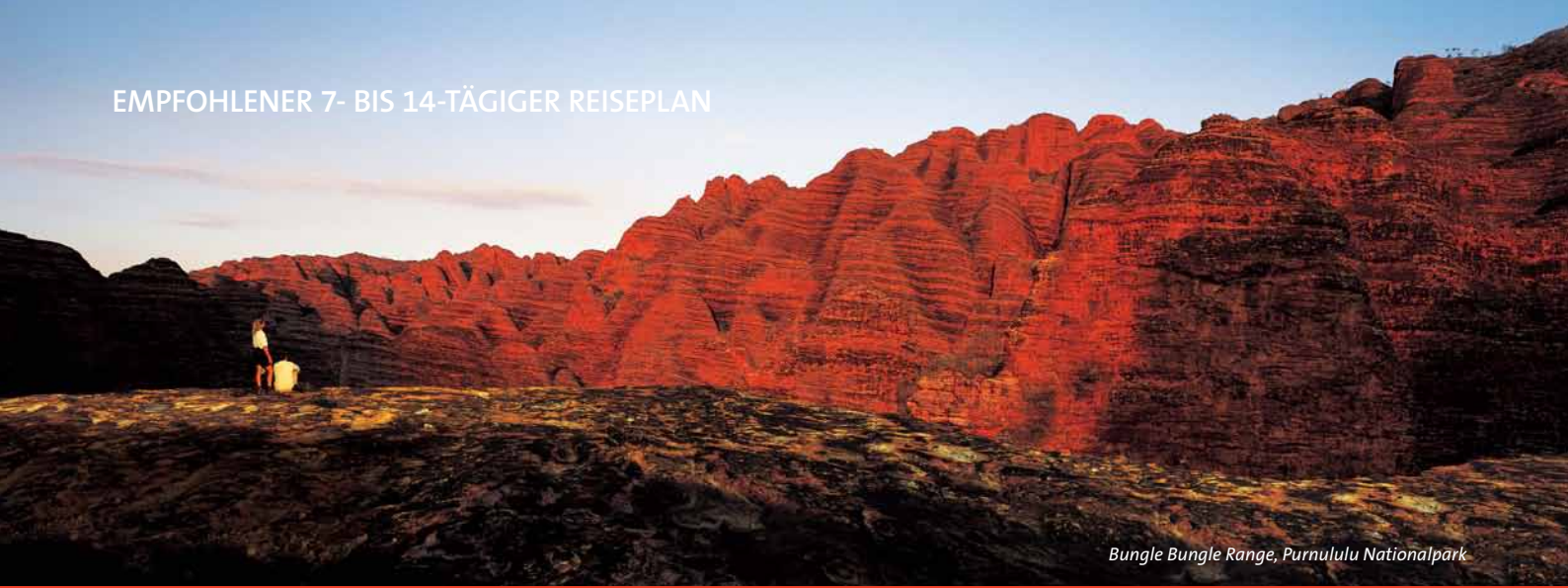
Bungle Bungle Range, Purnululu Nationalpark