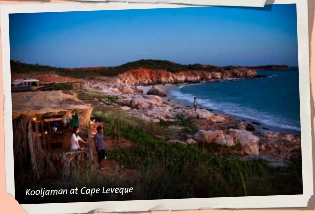
Kooljaman at Cape Leveque