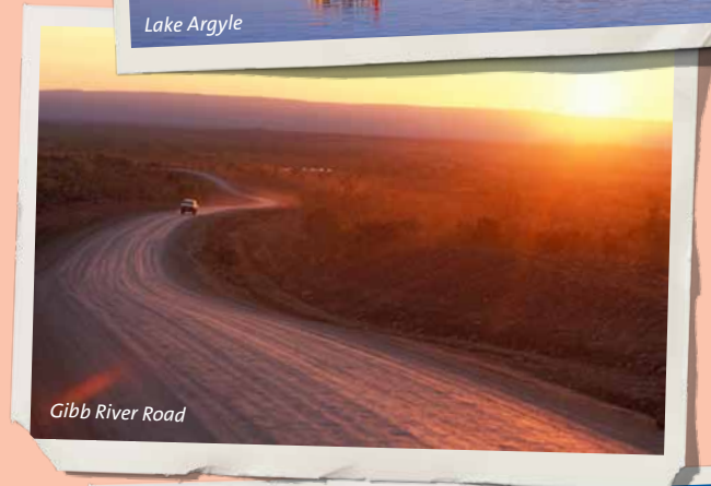
Gibb River Road