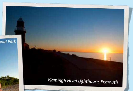
Vlamingh Head Lighthouse, Exmouth