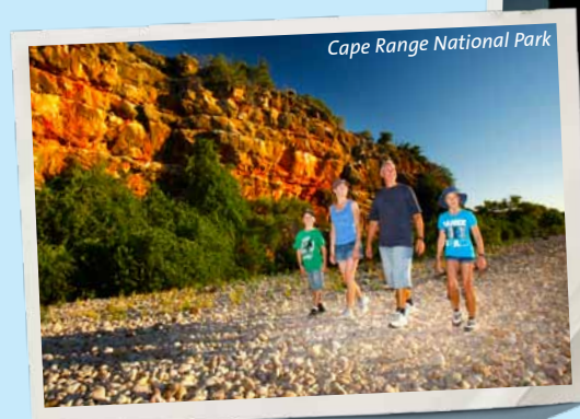
Cape Range National Park

Verbringen Sie den Tag mit der Erkundung der ausladenden Schluchten, der zerklüfteten Gipfel und der beeindruckenden Canyons aus rotem Felsgestein im Cape Range Nationalpark. Machen Sie eine Tour im Geländewagen zu einigen der berühmtesten Attraktionen des Parks, wie den Shothole- und Charles Knife-Canyons. Ein 5 km langer Buschwanderweg verbindet die beiden Schluchten und bietet atemberaubende Aussichten auf die Landschaft im Outback. Unterhalb des Felsenplateaus befindet sich ein Netzwerk aus verborgenen Höhlen und Tunneln, dem Lebensraum von einzigartigen Höhlentieren. Machen Sie eine Bootstour auf dem Yardie Creek, um eines der seltenen schwarzfüßigen Felsenwallabys zu erspähen, die in den Felswänden leben. In Mangrove Bay kommen Sie in der Beobachtungshütte nahe an Meeresvögel und Watvögel heran. Auch in der Mandu Mandu Gorge wimmelt es nur so vor Vögeln, und es gibt dort ebenfalls einen hervorragenden Buschwanderweg. Lassen Sie den Tag mit einem wunderbaren Sonnenuntergang über dem Indischen Ozean ausklingen, den Sie vom Vlamingh Head-Leuchtturm aus genießen können.