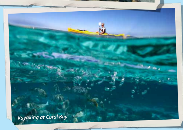
Kayaking at Coral Bay