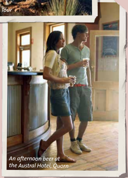
An afternoon beer at the Austral Hotel, Quorn