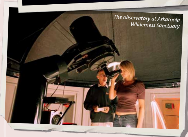
The observatory at Arkaroola Wilderness Sanctuary