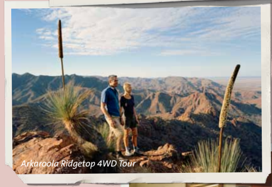
Arkaroola Ridgetop 4WD Tour